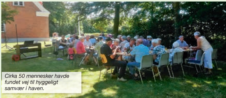
Cirka 50 mennesker havde fundet vej til hyggeligt samvær i haven.

Hermed et lille billedgalleri fra dagen: