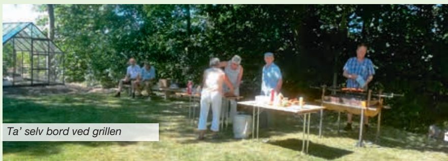
Ta' selv bord ved grillen