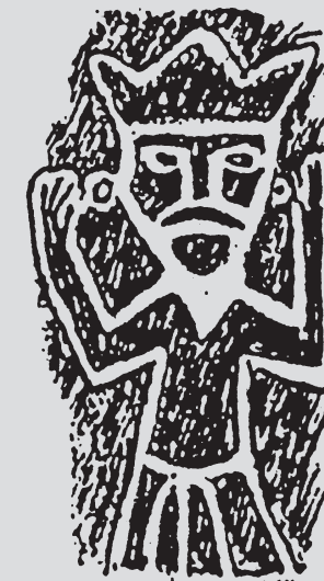
ERIK EJELOD I STABY KIRKE

Den 29. november er det 1. søndag i advent. Vi mødes til gudstjeneste, juletræstænding og sammenkomst i Sognegården.