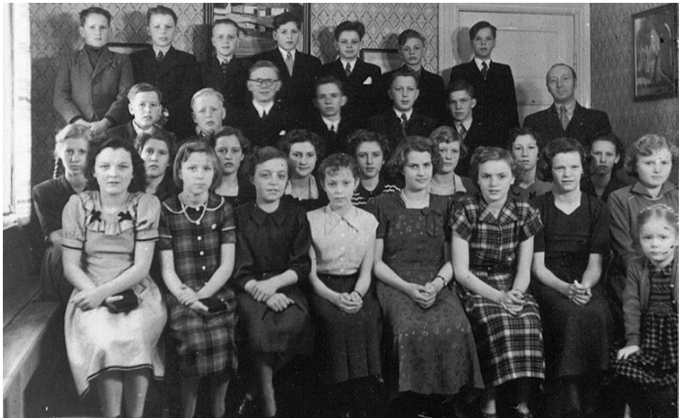
Konfirmander Staby 1952 (Nævnte efternavne er anno 1952).

Fotograferet i Staby Præstegård iført andendagstøjet.