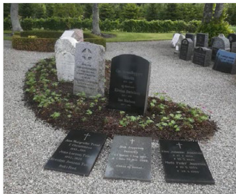
Et lille lapidarium på Madum Kirkegård

■ Kirkegårdstaksterne kan fås ved henvendelse til graverne og kirkeværgerne.