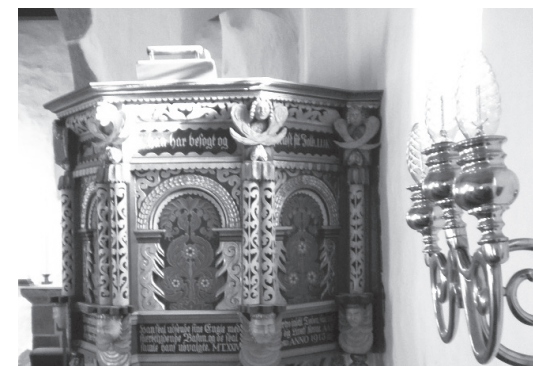
Prædikestolen i Madum Kirke.