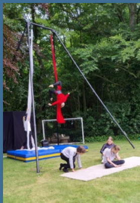
Artist arbejder i højen.