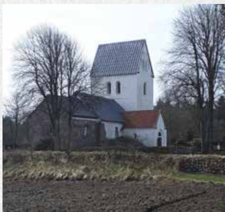
Madum Kirke – set fra øst Foto: JWA, marts 2021

vores tanker og idéer af sted til udvalget. Den 26. marts 2021 var fristen for, at menigheder og privatpersoner kunne give deres idéer videre til det udvalg, der arbejder med fremtidens gudstjeneste.