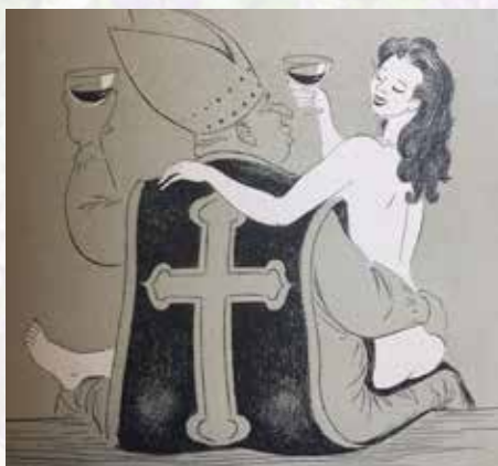
Billedet er et motiv fra en lille historie i Dekameron, der kritiserer dobbeltmoralen i den katolske præstestand i datidens kirke.

venskab, om kløgt og dumhed, om bedrag og hævn, og de spænder vidt: fra det humoristiske og erotiske til det dramatiske og tragiske.