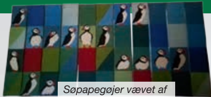
Søpapegøjer vævet af væversken Ann Slot.