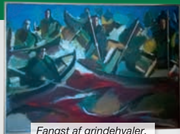
Fangst af grindehvaler.