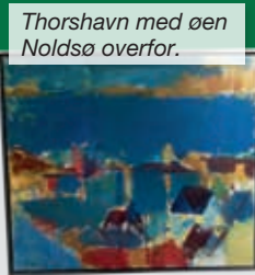
Thorshavn med øen Noldsø overfor.