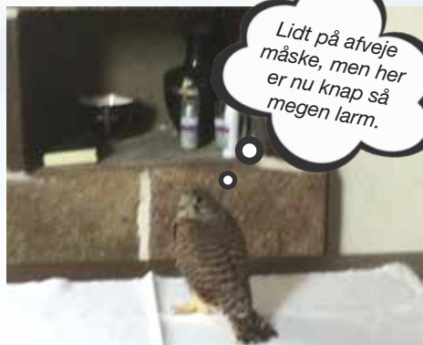
En stor tårnfalkeunge har fundet vej op i apsis