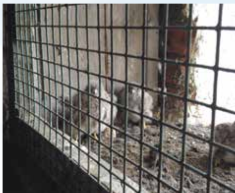
To forpjuskede unger i venteposition på proviant