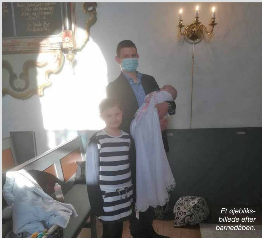
Et øjebliksbillede efter barnedåben.