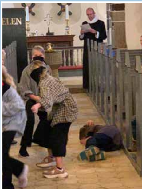
Minikonfirmanderne opfører 'Den barmhjertige samaritaner'. Billedet forestiller røverne, som lige har overfaldet manden fra Jerusalem.