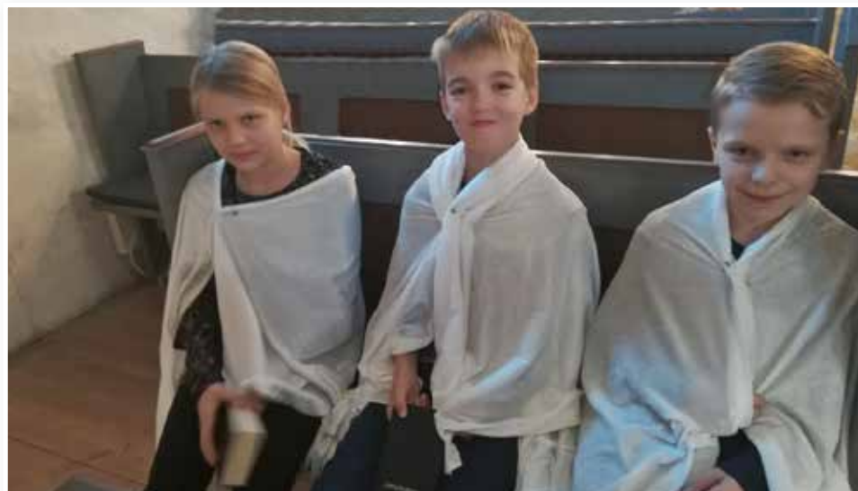
Krybbespillet opførtes den 1. søndag i advent. Aktørerne sidder klar.