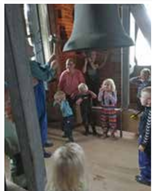
Ding dong, klokken får en ordentlig en af hammeren.