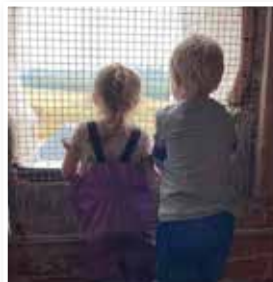
En dejlig oplevelse med børnene, som oplevede kirken såvel nede i skibet som oppe i tårnet.