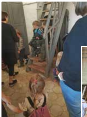
I venteposition til at komme op i tårnet.