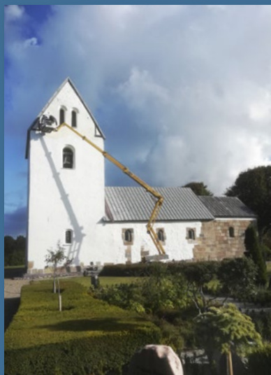
Tre raske dage med tørvejr i september måned, håndværkerne gik i gang med kalkningen, så Madum Kirke igen tager sig ud fra sin bedste side.