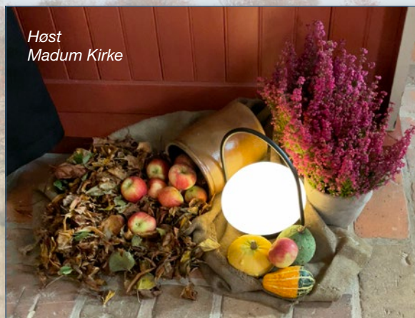
Høst Madum Kirke